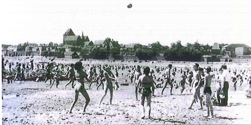
Plaża w Toruniu lata 60' (Zbiory Biblioteki Głównej UMK)